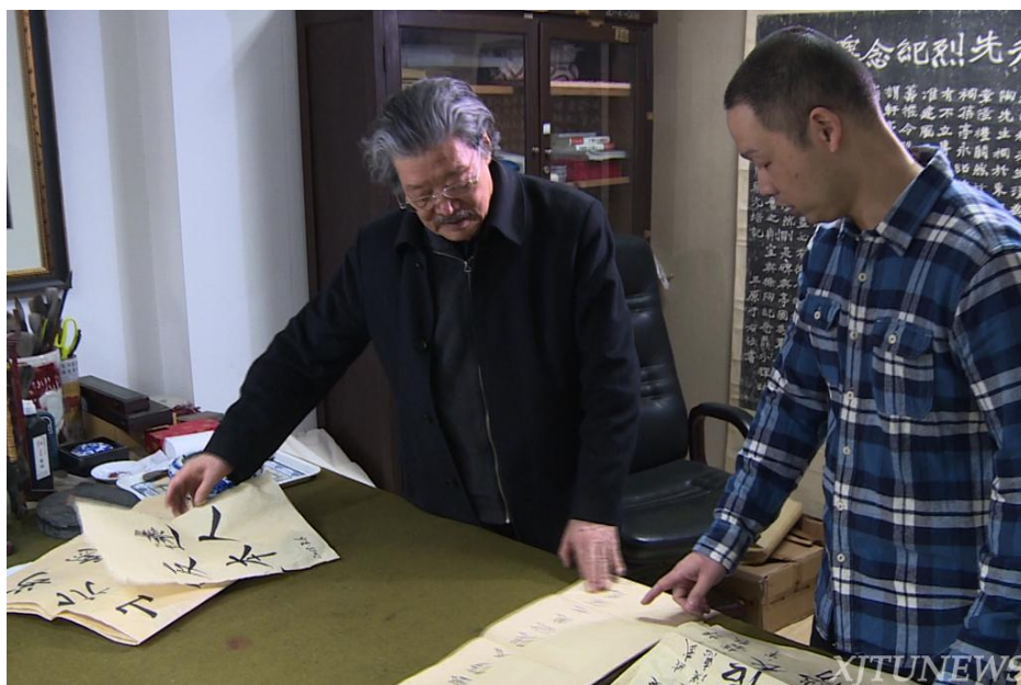
结缘交大 励志作中日文化使者

白，至今他还记忆深刻。“谦逊安静，刻苦认真，有礼貌。”这是同学们对他的评价。他漂洋过海来到这片土地，只为学习中国文化，这不禁让人想起阿倍仲麻吕、吉备真备为求学不远万里来到长安，抑或空海和尚在青龙寺一边学习密教一边学习书法，对促进中日友好交流做出了巨大贡献。安川怀着一腔热血来到西安交大，在钟明善老师门下苦心钻研中国书法，准备学成回国，将中国书法文化带回日本，发扬光大。