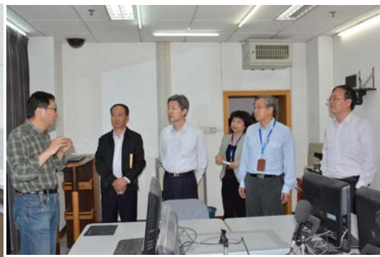
张迈曾书记听取实验室负责人介绍实验室情况

在实地调研后召开的座谈会上，5所学院围绕人才培养、科学研究、社会服务、队伍建设、学科建设等方面，分别汇报了学院的基本情况、特色经验与做法、面临的挑战和存在的问题及建议，提出了学院在高层次人才引进、学科结构、招生规模与配套政策、教学与科研的平衡等方面存在问题与解决思路。